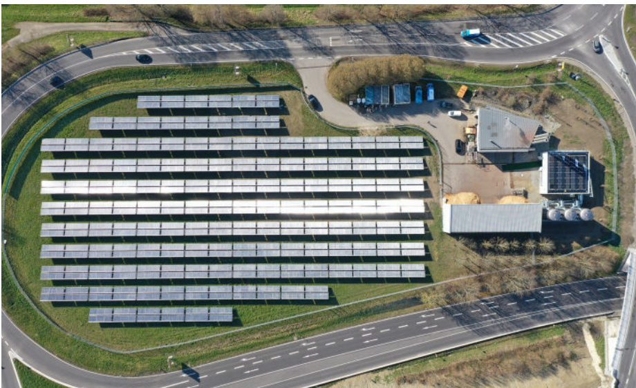
Kollektorfeld in Überlingen von oben

Für weiterführende Informationen stehen wir Ihnen gerne zur Verfügung.