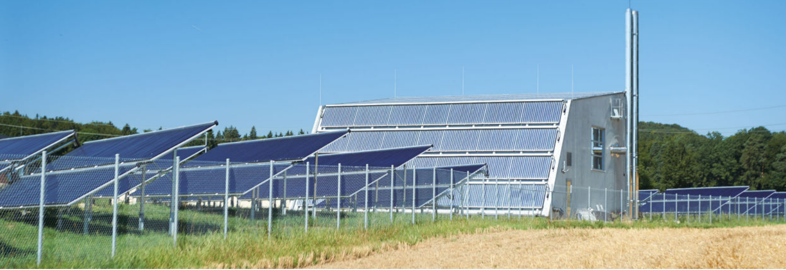
Kollektorenfeld in Büsingen mit zusätzlichen Kollektoren an der Fassade des Kesselhauses